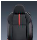
20 - Negro (Black) BRZ Limited 6MT y BRZ Limited 6AT EyeSight®