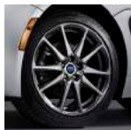
Rines de aleación de aluminio 18" BRZ Limited 6MT y BRZ Limited 6AT EyeSight®